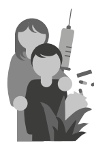
Gesundheit und Betreuung