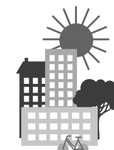
Zukunftsweisendes Wohnen und Arbeiten