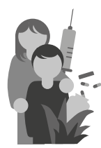
Gesundheit und Betreuung