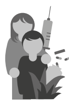
Gesundheit und Betreuung